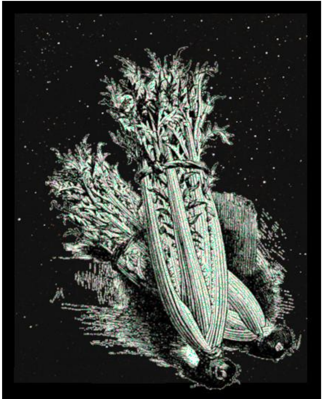
En pleine largeur de page : deux cardons liés sur fond étoilé. Aucune écriture ne vient plus